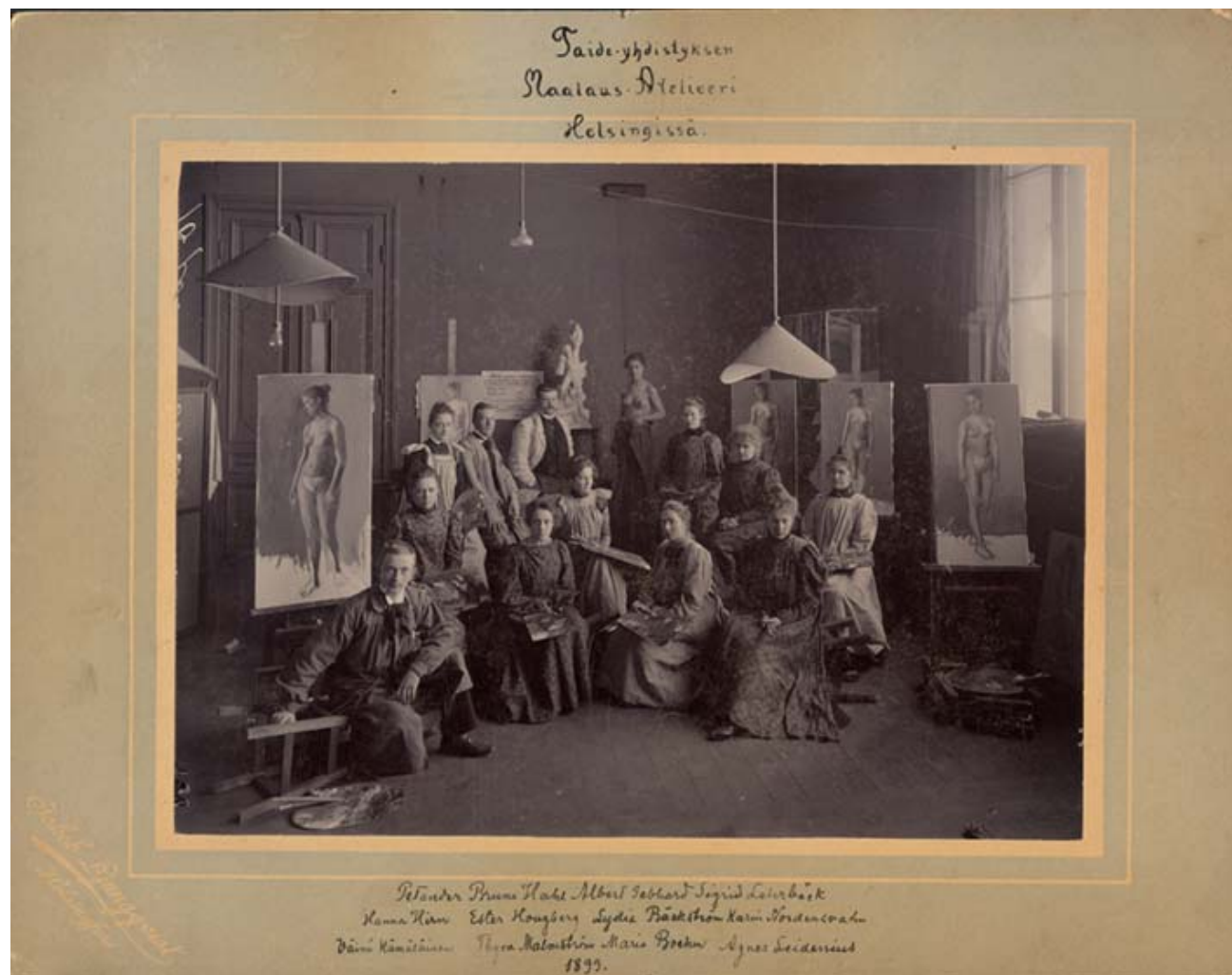
Suomen Taideyhdistyksen Piirustuskouluun oppilaita Ateneumissa, 1899.