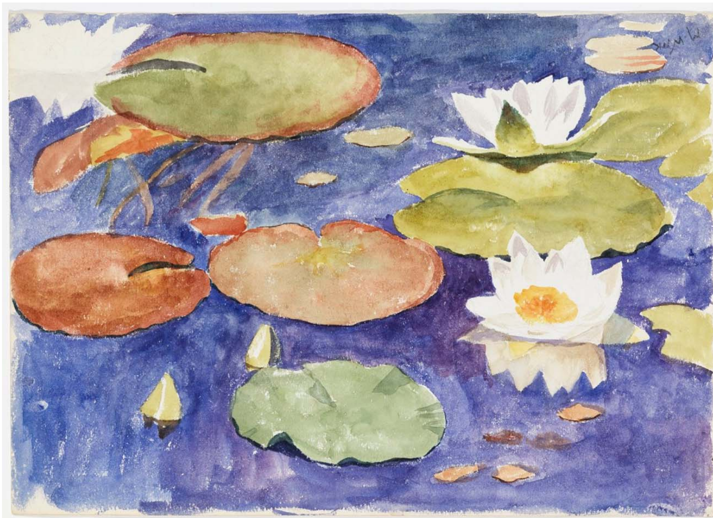
Maria Wiik, Lumpeenkukkia vedessä , ajoittamaton, Kansallisgalleria / Ateneumin taidemuseo

Kansallisgallerian aikaisempiin kokoelmahallintajärjestelmiin luetteloidut arkisto-, kuva-, esine- ja taidekokoelmat sekä Valtion taideteostoimikunnan kokoelma on siirretty uuteen, yhteiseen järjestelmään, joka mahdollistaa eri aineistojen hallinnoinnin samoilla periaatteilla.