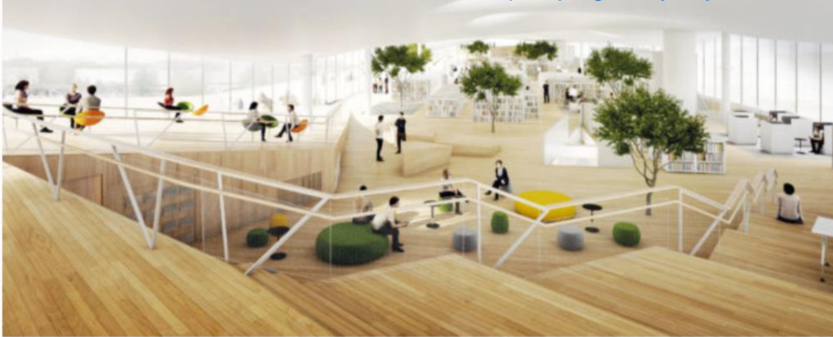
Havainnekuva Helsingin keskustakirjaston ylimmästä kerroksesta, ALA Arkkitehdit.