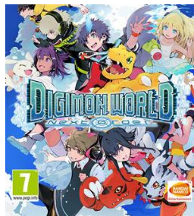
Toisena esimerkkinä konsolipeli Digimon world