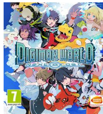
Toisena esimerkkinä konsolipeli Digimon world