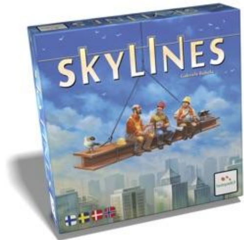
Esimerkkinä Lautapeli Skylines