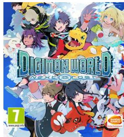
Toisena esimerkkinä konsolipeli Digimon world