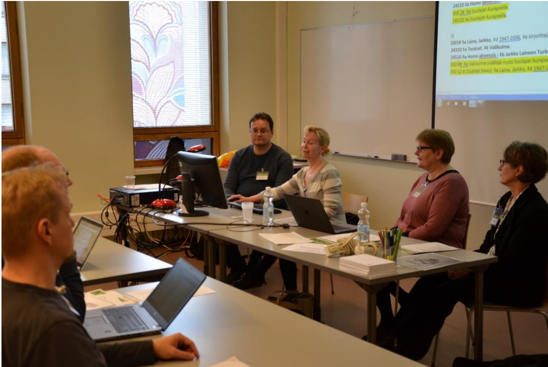
KUMEAlaisia kirjastoverkkopäivien työpajassa 2017