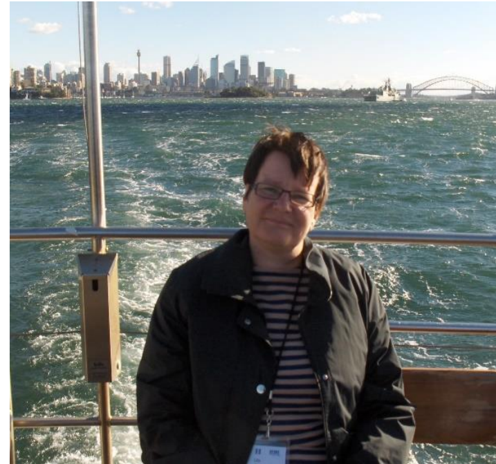
IAMLin kokous Sydneyssä 2007