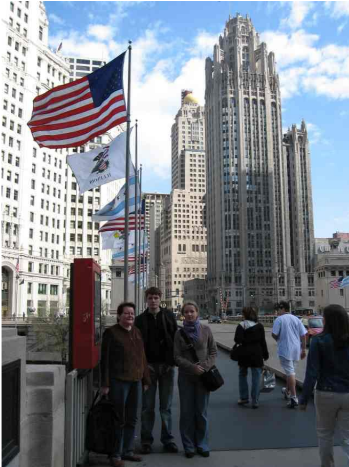
Suomalaisdelegaatiota Voyagerin käyttäjäkokouksessa 2006

VTLS-osakohteita Sibelius-Akatemian kirjastossa ja HYKissä