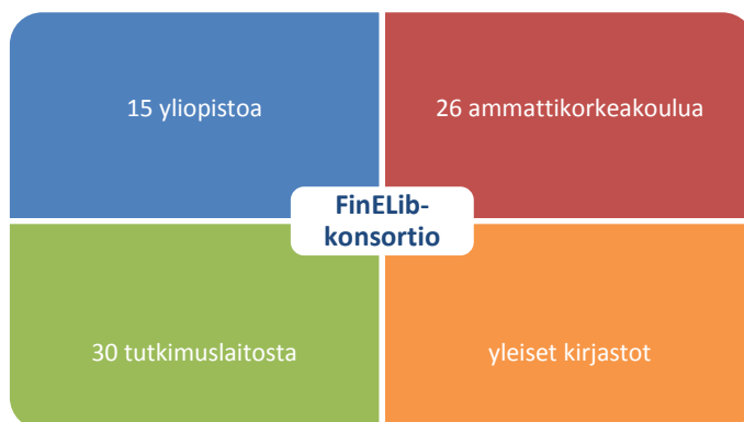
Kuva 1: FinELib-konsortion jäsenet vuoden 2016 alussa

FinELib-konsortiossa olivat vuoden 2016 alussa mukana kaikki Suomen yliopistot (15), ammattikorkeakoulut (26) ja yleiset kirjastot sekä 30 tutkimuslaitosta ja erikoiskirjastoa.