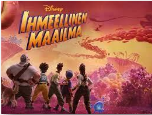
Elokuva Ihmeellinen maailma , julkaisuvuosi 2023