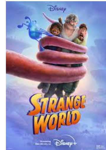
Manifestaatiot DVD-videolevy, Blu-ray-videolevy ja digitaalinen elokuva