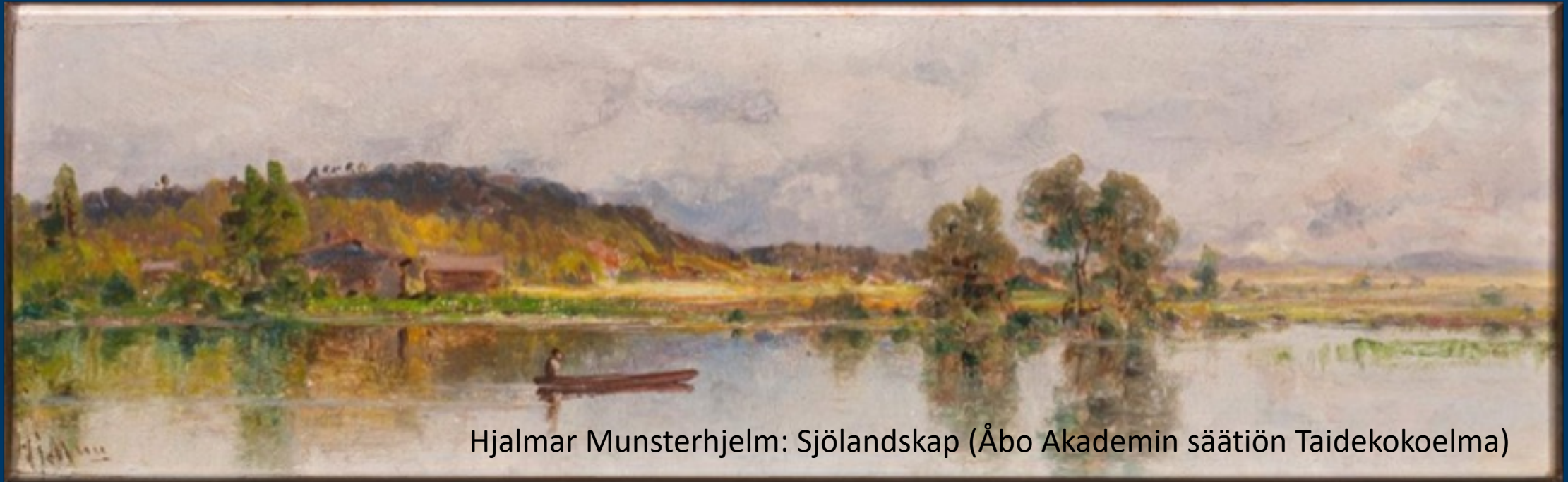
Hjalmar Munsterhjelm: Sjölandskap (Åbo Akademin sÄatiön Taidekokoelma)

Museoiden lisäksi sÄatiö omistaa laajan taidekokoelman.