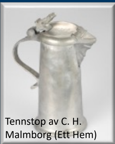
Tennstop av C. H. Malmberg (Ett Hem)