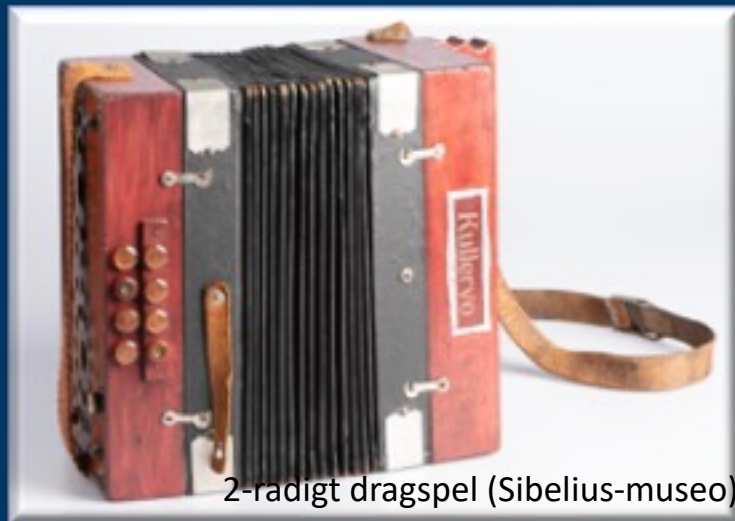
2-radigt dragspel (Sibelius-museo)