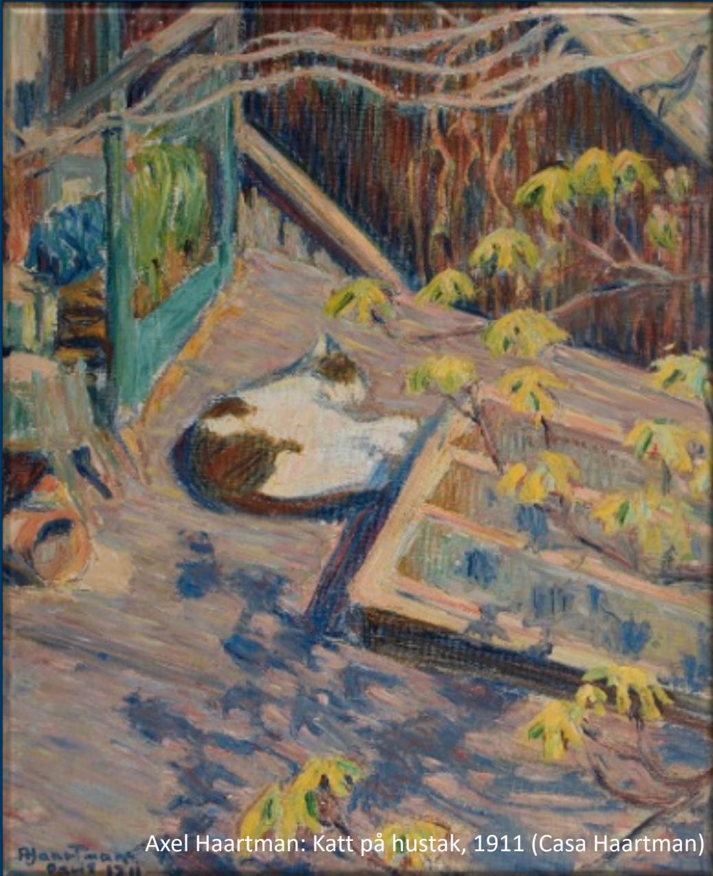
Axel Haartman: Katt på hustak, 1911 (Casa Haartman)