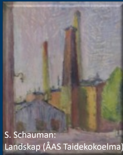
S. Schauman: Landskap (ÅAS Taidekokoelma)