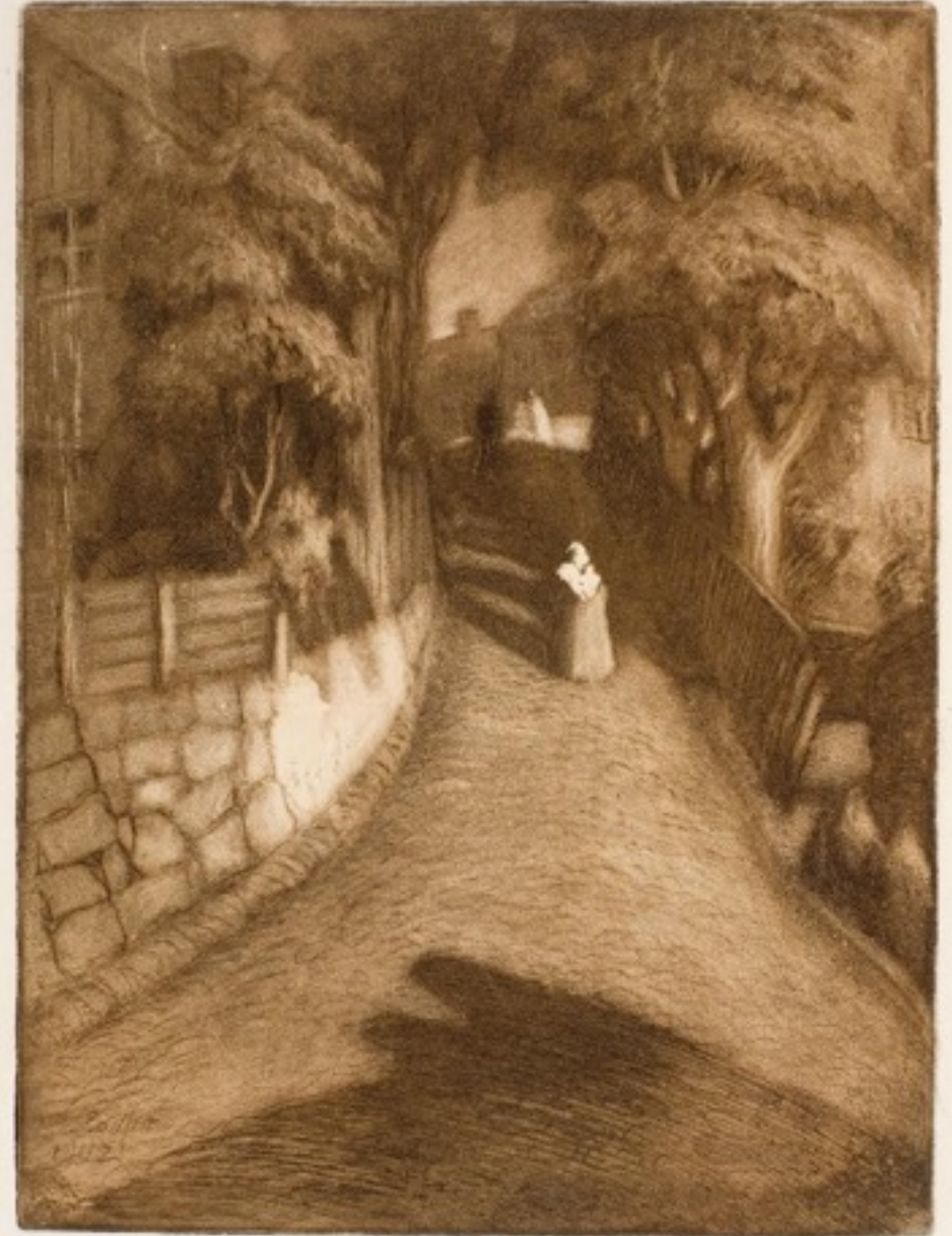
Albert Edelfelt: Gata i Borgå, 1902 (Ett Hem -museo)