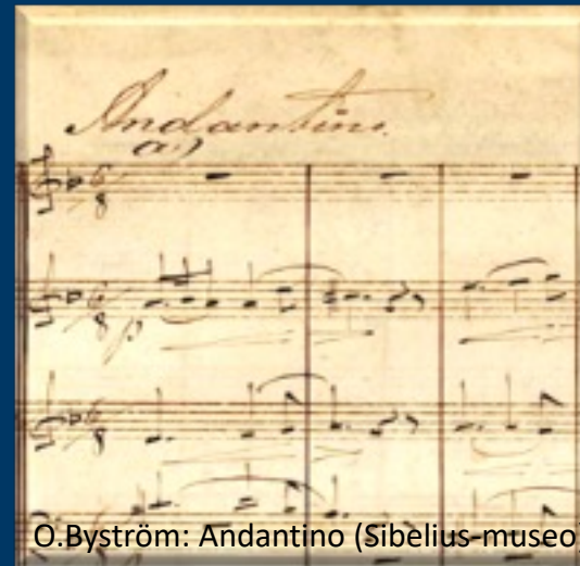
O. Byström: Andantino (Sibelius-museo)