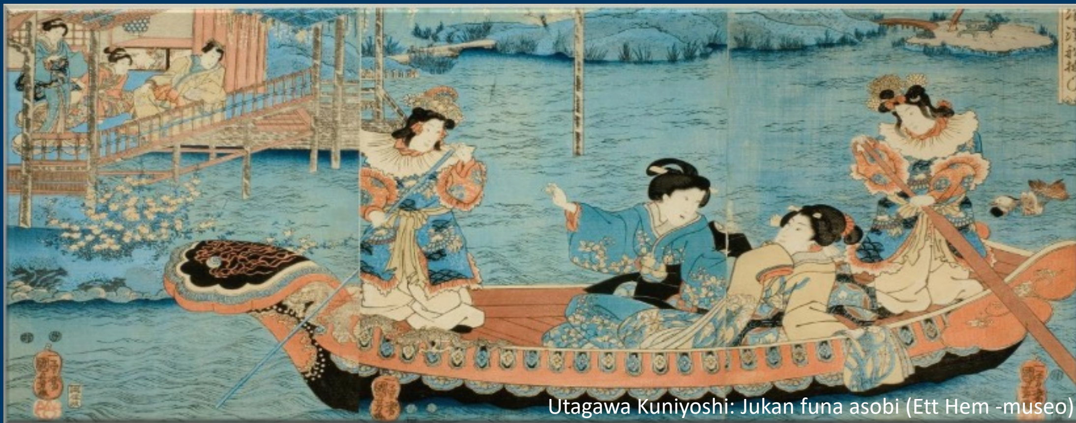
Utagawa Kuniyoshi: Jukan funa asobi (Ett Hem -museo)