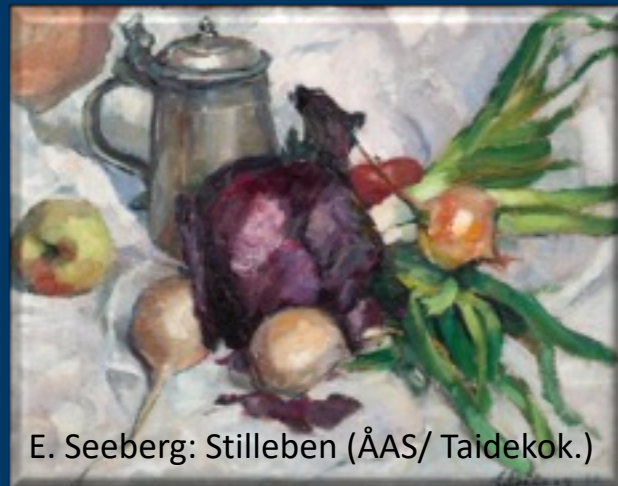
E. Seeberg: Stilleben (ÅAS/ Taidekok.)