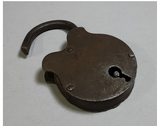
Kuva: lukko; riippulukko.