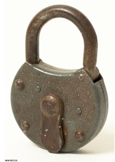
Kuva: Lukko.