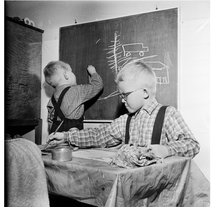
Kuva:Kaksi lasta taiteilemassa. 1957.