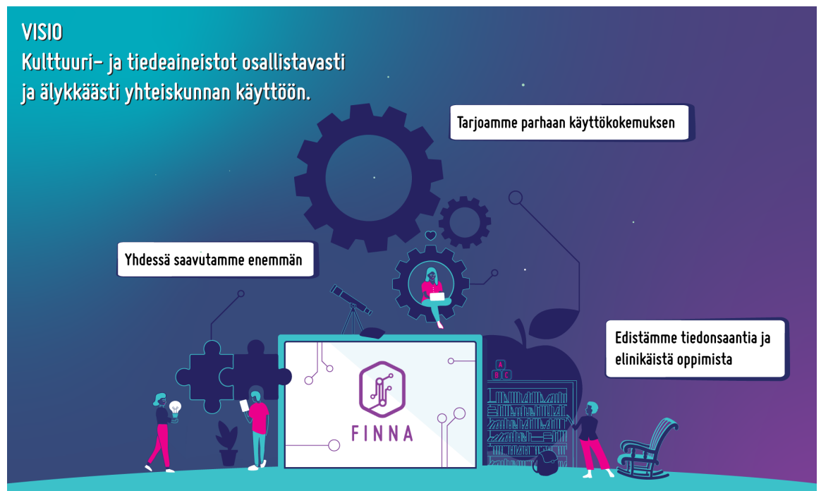
Kuva 1. Finnan visio 2025

Toimintasuunnitelmaan kirjatut tehtävät ja toimenpiteet toimivat palvelun kehitysjonona, josta toteutukseen otetaan ketterän toimintakulttuurin mukaisesti kulloinkin tarkoituksenmukaisimmat tehtävät.