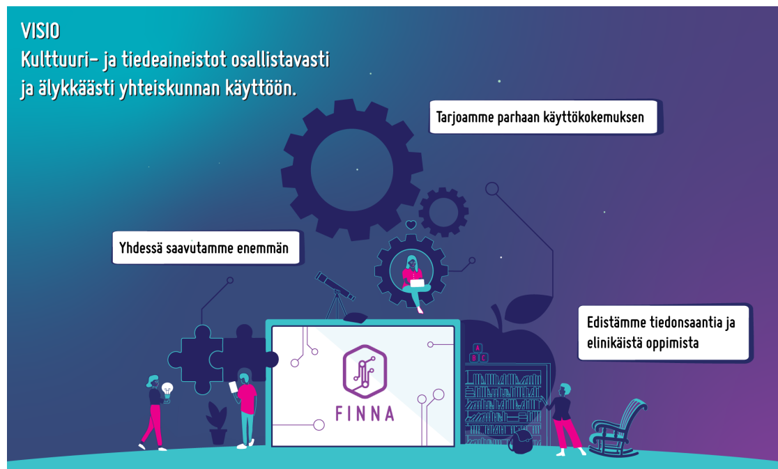
Kuva 1. Finnan visio 2025

Toimintasuunnitelmaan kirjatut tehtävät ja toimenpiteet toimivat palvelun kehitysjonona, josta toteutukseen otetaan ketterän toimintakulttuurin mukaisesti kulloinkin tarkoituksenmukaisimmat tehtävät.