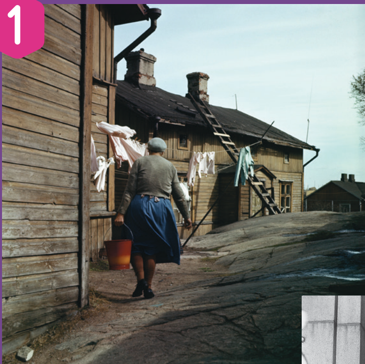
Ovan: Gårdsplan på Oihonnagatan 5, 1950–1959.