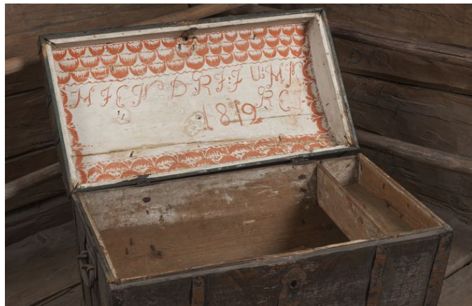
arkku Kansallismuseo, CC BY 4.0