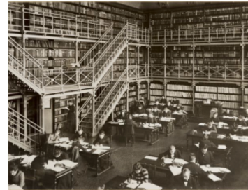
Nyblin Daniel, kuvaaja. Valtionarkiston tutkijasali, 1901. CC BY 4.0 Museovirasto

Rekisteröityminen Finna-tutkijasalipalveluun