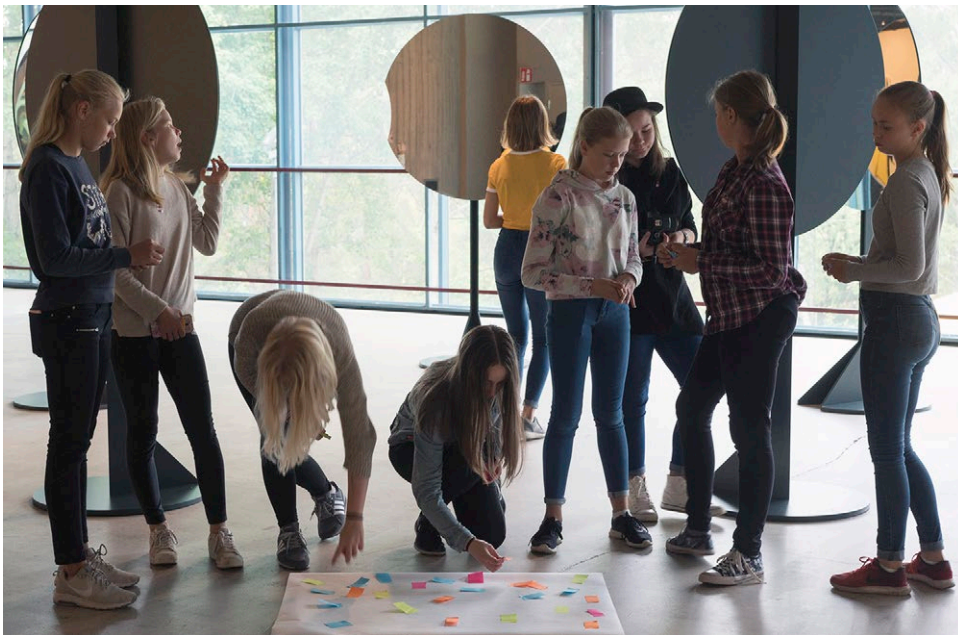
Kahdeksasluokkalaiset osallistuivat Espoon modernin taiteen museo EMMAssa Taidetestaajat-hankkeeseen, jossa oman taiteilijakaverin kanssa tutustuttiin taiteeseen ja vierailtiin museossa.

Museot ovat paikallisia, alueellisia ja valtakunnallisia kulttuuri- ja luonnonperinnön sekä taiteen osaajia. Museoiden palvelut kehittyvät vuorovaikutuksessa asiakkaiden ja eri väestöryhmien kanssa. Museot lisäävät alueidensa elinvoimaisuutta. Ne edistävät yhteiskunnallisesti tärkeiden kulttuuristen, sosiaalisten, ekologisten ja taloudellisten tavoitteiden toteuttamista. Paikalliset kotiseutu- ja erikoismuseot toimivat rinnakkain ja yhteistyössä ammatillisten museoiden kanssa.