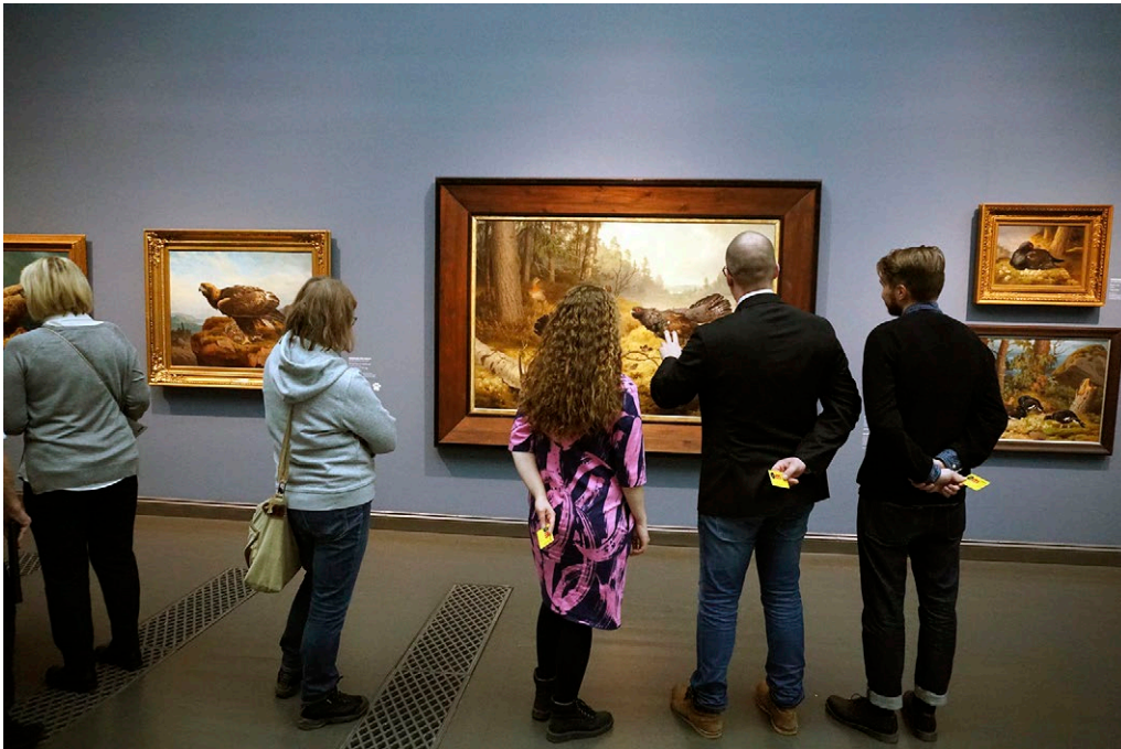
Museokortti on Suomen museoliiton lanseeraama museoiden yhteislippu, jolla pääsee yli 250 museokohteeseen Suomessa.

Museot palveluineen ovat verkostoituneet julkisten ja yksityisten rahoittajien sekä elinkeinoelämän kanssa. Toiminnan perusrahoitus katetaan julkisin varoin. Museot ovat tiivistäneet yhteistyötään ja hyödyntävät jaettua osaamista sekä pitkälle kehittyntä työnjakoa kiinteiden kustannusten kasvun hallitsemiseksi ja uusien ansaintamallien rakentamiseksi. Museoiden talous on kestäväällä pohjalla ja niiden rahoituspohja on laajentunut museoiden palveluja hyödyntäville elinkeino-, koulutus- ja sosiaalisektoreille. Museot ovat ottaneet käyttöön innovatiivisia rahoitusmuotoja.