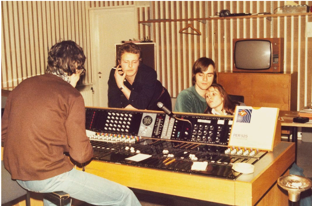
Finna-palveluun on koottu Suomen museoiden, kirjastojen ja arkistojen aineistot kaikkien saataville. Kuvassa yhtye nimeltä Hawks nauhoittaa Yleisradion studiossa Liisankadulla Helsingissä.

Digitaalisuus tukee läpäisevästi museoiden työtä kulttuuriperinnön vaalimiseksi ja välittämiseksi kaikille. Palveluiden tarjoaminen monien eri kanavien kautta luo merkittävää lisäarvoa sekä museoille että asiakkaille. Digitaalisuus on avannut uusia tapoja ymmärtää kulttuuriperintöä, osallistua ja kokea osallisuutta. Museoiden aineistot ja tieto ovat helposti saatavilla sekä yhteisten että yksilöityjen digitaalisten palveluiden kautta. Vapaasti saatavilla olevia aineistoja hyödynnetään laajasti ja luovasti yhteiskunnan eri osa-alueilla. Kansallinen kulttuuriperintö saavuttaa ihmiset yhä laajemmin ja moninaisemmilla tavoilla myös kansainvälisesti.